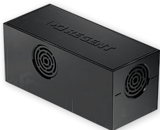
Modulo di comunicazione ALONEatWORK®

Basta metterlo in piedi senza alcuno sforzo di programmazione. ALONEatWORK® è progettato in modo ottimale per apparecchi mobili. Inoltre, gli apparecchi compatibili con questa tecnologia possono essere facilmente aggiornati in qualsiasi momento.