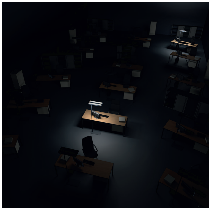
Simulazione: ufficio open space con isole di luce