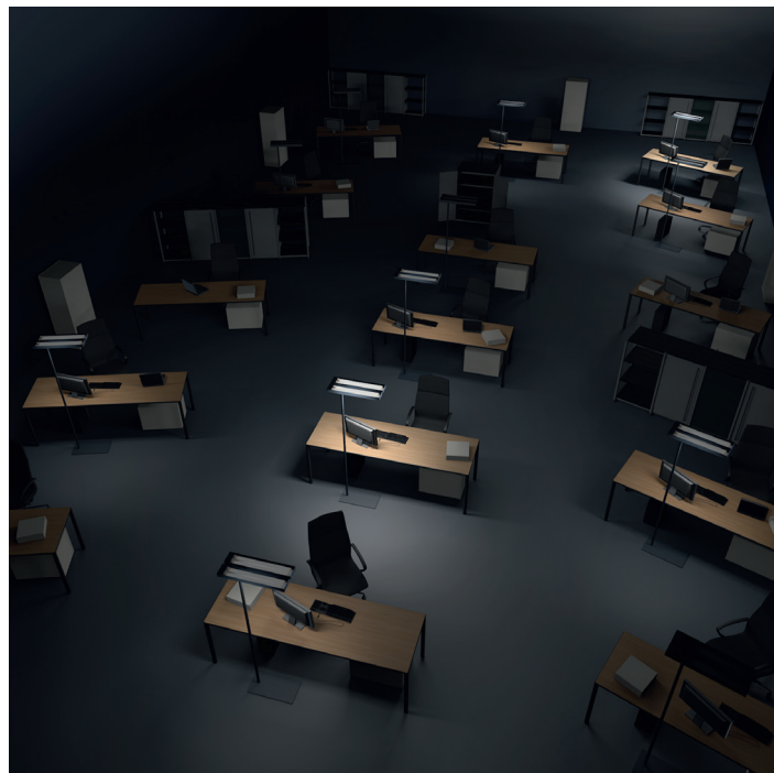
Simulazione: piacevoli nuvole di luce con ALONEatWORK®