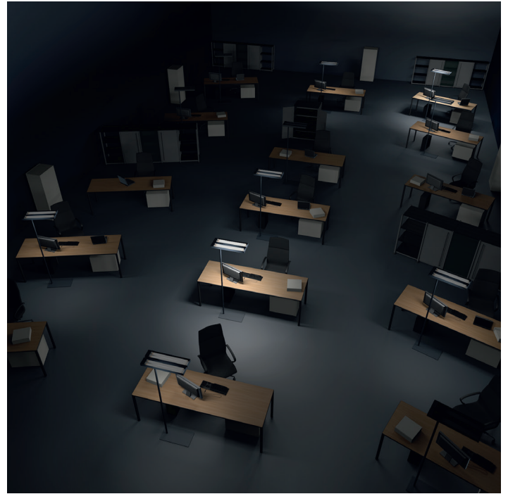
Simulation des nuages de lumière avec ALONEatWORK®

Quand les personnes quittent les bureaux en open space le soir, de véritables îlots de lumière apparaissent autour des bureaux des personnes qui sont encore là. Le contraste abrupt de la lumière à l'obscurité nous donne un sentiment d'isolement et, comme notre efficacité dépend fortement de la lumière, la capacité de concentration diminue rapidement. Cependant, allumer l'éclairage général dans une telle situation serait un gaspillage. Mais notre technologie de communication ALONEatWORK® offre une réponse durable à ce défi.