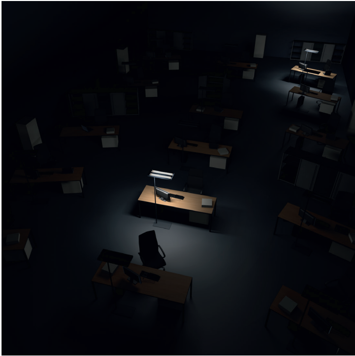
Simulation d'un bureau en open space avec îlots de lumière